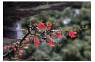
莫愁湖海棠花开

快报讯（通讯员 吕欣 记者 刘伟娟）昨天，莫愁湖公园迎来第三十三届海棠花会。现代快报记者了解到，到目前为止，园内的“一品香”“舞美”“成都木瓜海棠”等10多个海棠早花品种，不负众望一起盛开。