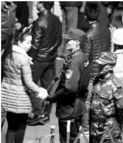
灯会顺利举办,离不开他们的付出