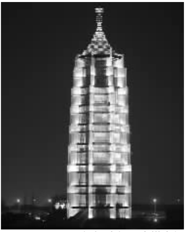
昨晚,大报恩寺塔亮灯

不过,要看最奇幻的“大报恩寺轻质保护塔”灯光秀,要等正式开园。未来,不乏有“建筑裸眼3D投影”呈现。