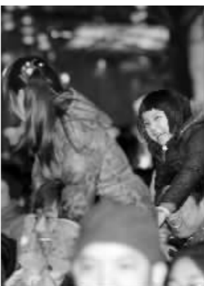
小朋友们可开心了