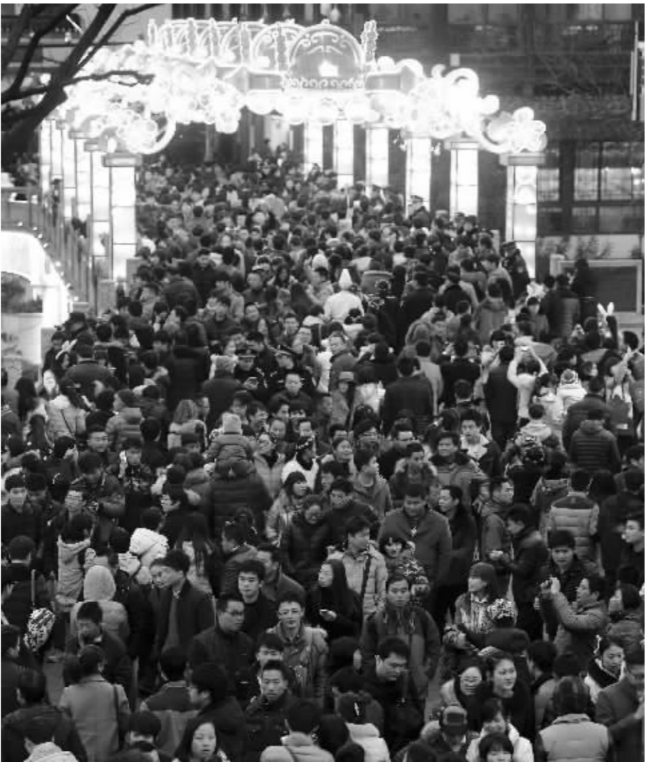
昨晚,夫子庙景区灯光璀璨、人头攒动