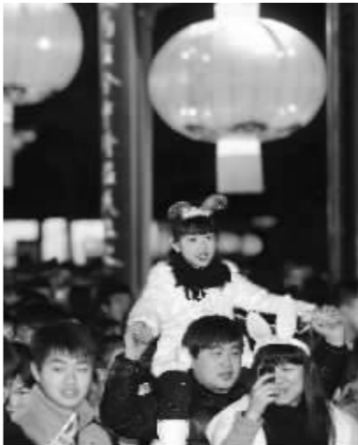
这个小朋友精神头很足