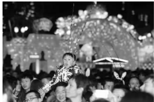
“齐天大圣”看来有点累了