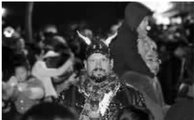
洋朋友戴“羊角”对着镜头做鬼脸