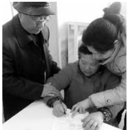
黄阿姨在捐献遗体同意书上签字