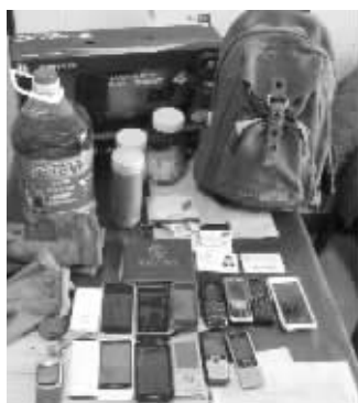
部分未被认领的失物

快报讯(通讯员 孙洪 记者 王益)春节前后,公交车也迎来了一波客运高峰。乘客多了,“马大哈”也随之增多。这几天,扬子公交浦口公司正在为办公室里满满的失物发愁。