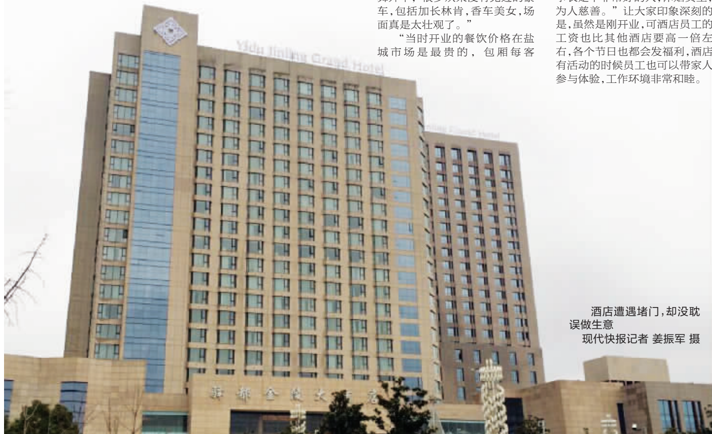
酒店遭遇堵门,却没耽误做生意

据记者了解,盐城市政府目前成立了专门的工作小组介入此事,地方政府通过为企业垫付资金的方式已经将部分拖欠款项发放到农民工手中。2月27日,该工作小组一位负责人告诉记者,事情发生后,政府部门第一时间成立了工作组,对发生债权债务关系的工程队进行逐一登记,初步了解情况,稳定大家的情绪,做好宣传引导工作。“目前,已登记的1个多亿,其中农民工一千多万的工资已经在春节前全部发放到位。”该负责人称,“受此影响,驿都金陵大酒店现在确实存在资金紧张的情况,但经过对账和测算发现,酒店的资产和负债相差数额有限。”这名负责人同时强调,市场经济、经济下行的环境下企业遇到资金压力也是很正常的事情,政府将以“吸收、接管”的方式帮助驿都金陵大酒店渡过难关,“日后政府会寻找资金实力雄厚的企业,对驿都金陵大酒店进行重组,但这需要时间和过程。”