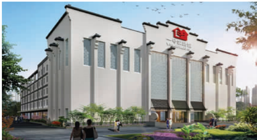
位于中央路266号的一号家居馆

房子搞定了，你以为就大功告成了？亲，万里长征才走了一半。不过，如果选择对了，后面的长征路也就平坦了。一号家居网告诉你，O2O家居平台已经率先进入免费时代，在一号家居网装修免人工费、品牌家电免费送、装修还可一年后付款……如果你也想加入一号家居业主的大家庭，享受这么多的免费服务，就跟着来吧。 现代快报记者 童婷婷