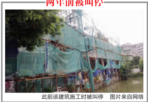
此前该建筑施工时被叫停