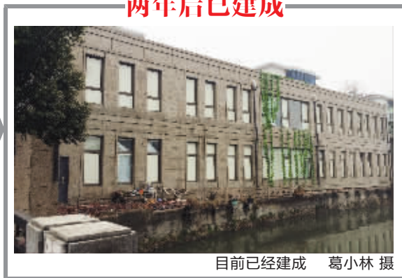
目前已经建成

近日有网友爆料称，常州翠竹的两幢别墅由于改建没手续，2012年就被城管叫停。然而两年后，这一建筑竟在今年春节后“满血复活”，建成完工，被网友称为“最牛违建”。记者昨天从常州天宁城管获悉，城管部门已正式立案，如果户主在限定期限内不能取得合法手续，该建筑可能面临强拆和罚款。 葛小林