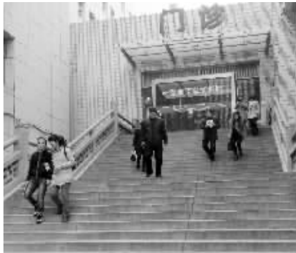
许多人步行通过第一医院门诊楼高高的台阶就诊