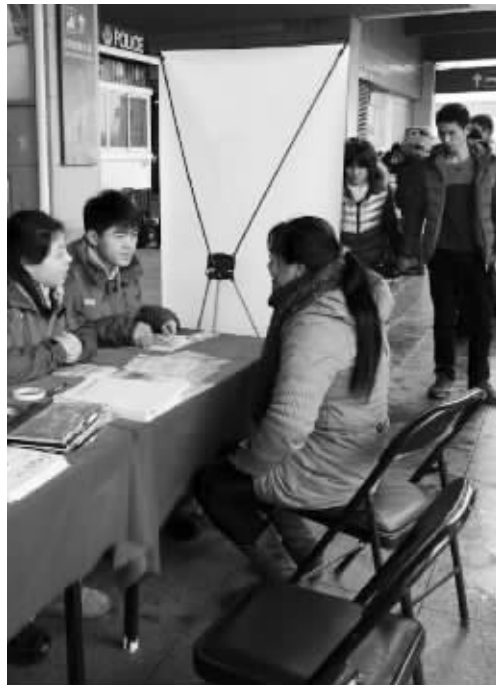
春风送岗位活动现场

昨天,玄武区人社局在南京火车站站前广场举行春风送岗位活动,15家招工单位提供300多个岗位,吸引了很多刚刚来宁的务工人员。现代快报记者发现,来宁务工人员在选择工作时不再“将就”,找工作的标准包括:月薪、福利待遇、环境、劳动强度等。 现代快报记者 项风华 徐岑