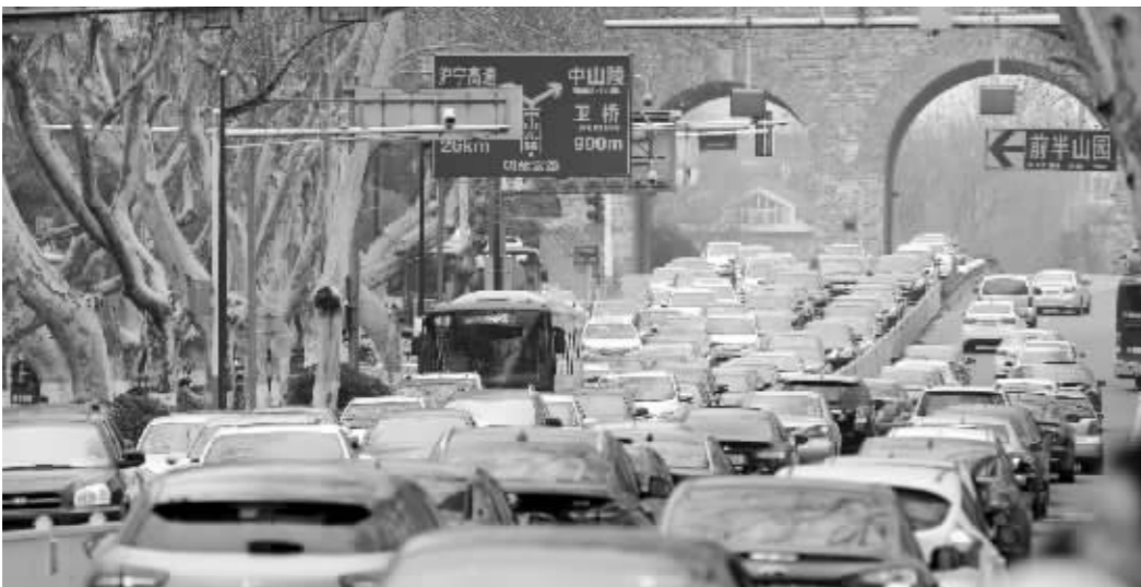
昨天下午,南京中山门进城车辆排起长龙

现代快报记者获悉,7天长假,全省高速公路网日均出口流量约144万辆,同比增加20%;单日出口最大流量出现在正月初五,达185万辆,同比增加33%。南京交警表示,这几天早高峰不会太堵。