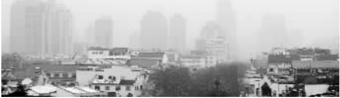
大年初四,南京城重度污染

今年春节,没有了烟花爆竹的燃放,南京空气质量怎么样呢?现代快报记者查询了南京市环保局的官方数据,发现,整个春节期间,除了初四为重度污染,初五是轻度污染外,其他均为优良。很多南京市民也纷纷为这样的“好空气”点赞,并称:春节期间PM2.5不再“爆表”。