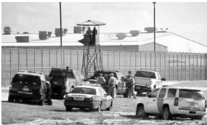
大量警车在监狱外待命

美国《休斯敦纪事报》昨天报道,美国得克萨斯州南部一座监狱20日发生大规模骚乱,约2000名犯人与警方对峙,抗议监狱医疗服务条件差。截至昨晨,骚乱已造成数名狱警和犯人受伤。报道指出,有报告称,在得州不少监狱都存在医疗服务差的现象,很多囚犯在病痛时,依然被安排在条件恶劣的狱室内。美国联邦调查局(FBI)发言人当地时间21日晚表示:“骚乱状况尚未解决,不过我们即将和平解决。”综合