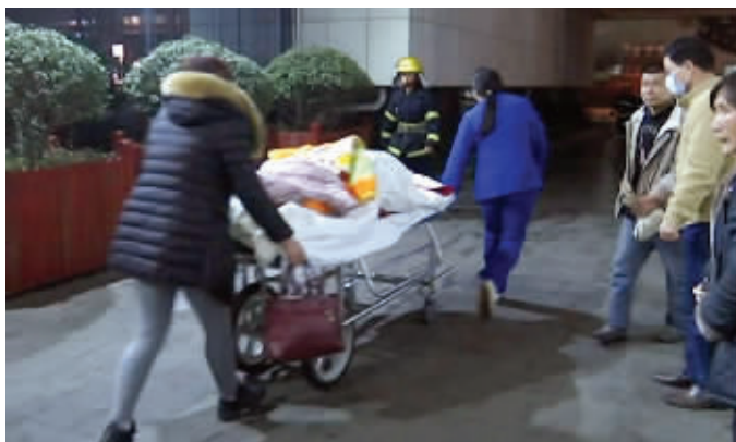
事发时转移患者

不少患者告诉现代快报记者,火灾发生后,并未见有医护人员前来组织转移,他们均是遭受烟雾侵袭后,各自搀扶病号下楼逃生。据悉,遗留在医院的病患中,不少均是年老体衰,行动不便,而在产科,至少上百名孕妇和新生儿。