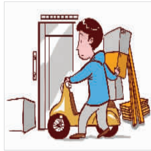
清理好楼道