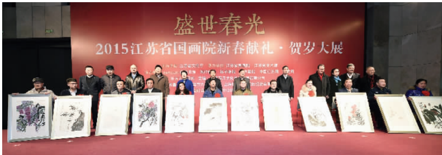
12位见义勇为代表获赠贺春佳作

昨天上午,由江苏省文化厅主办,江苏省国画院、江苏省美术馆承办,现代快报等协办的“盛世春光——2015江苏省国画院新春献礼·贺岁大展”正式在江苏省美术馆拉开帷幕。