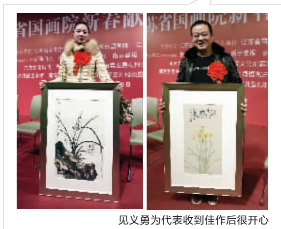
见义勇为代表收到佳作后很开心