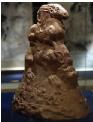
飞羊乘人钱树陶插座