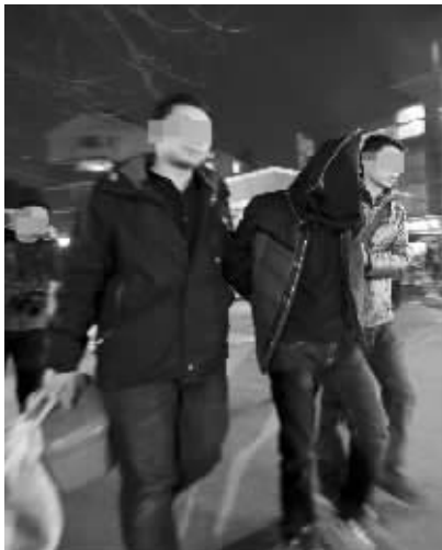
警方抓获贩毒嫌疑人