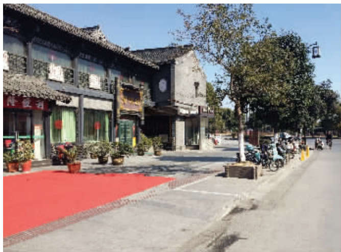
当天晚上,靳女士的车停在路边,小伙骑车撞上了