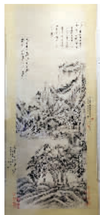
《仿郭恕先山水图轴》