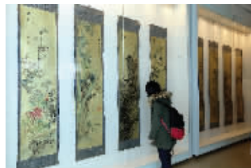
市民观展

这次换展后,展厅中的藏品不会再更换。展览一直到3月8日结束,感兴趣的观众可免费参观。 现代快报记者 胡玉梅