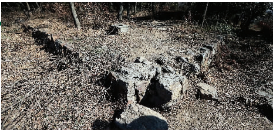
一号祭坛在六朝祭坛中面积最大,上面立着一座“民国碉堡”