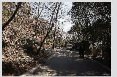
一号、二号祭坛隔着一条路