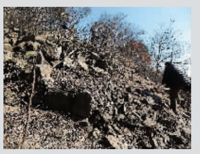
二号祭坛被游客踩出一条登山道