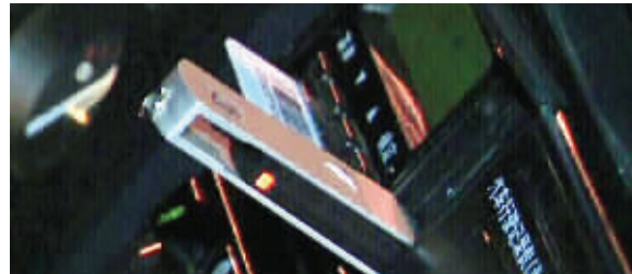
这种小U盘能测出驾驶员是否疲劳驾驶

江苏省公安厅交警总队负责人告诉记者,通过疲劳驾驶监测系统,民警能第一时间发现驾驶员是否存在疲劳驾驶行为,对存在疲劳驾驶行为的驾驶人,民警除了依法处罚以外,还会采取强制休息等措施,消除其违法状态。