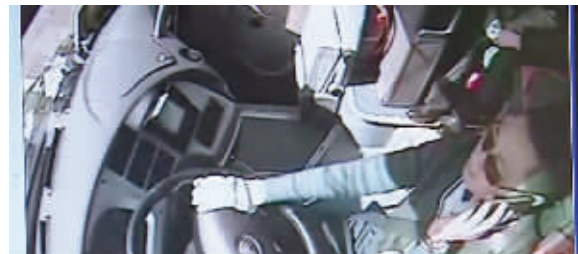
监控拍下驾驶员正在打手机

江苏省公安厅交警总队负责人告诉记者,跟以往抽查司机行车记录仪相比,通过动态监控平台能实时监测司机的一举一动,这就要求司机在行车过程中必须将乘客安全放在第一位,不做任何影响行车安全的事。