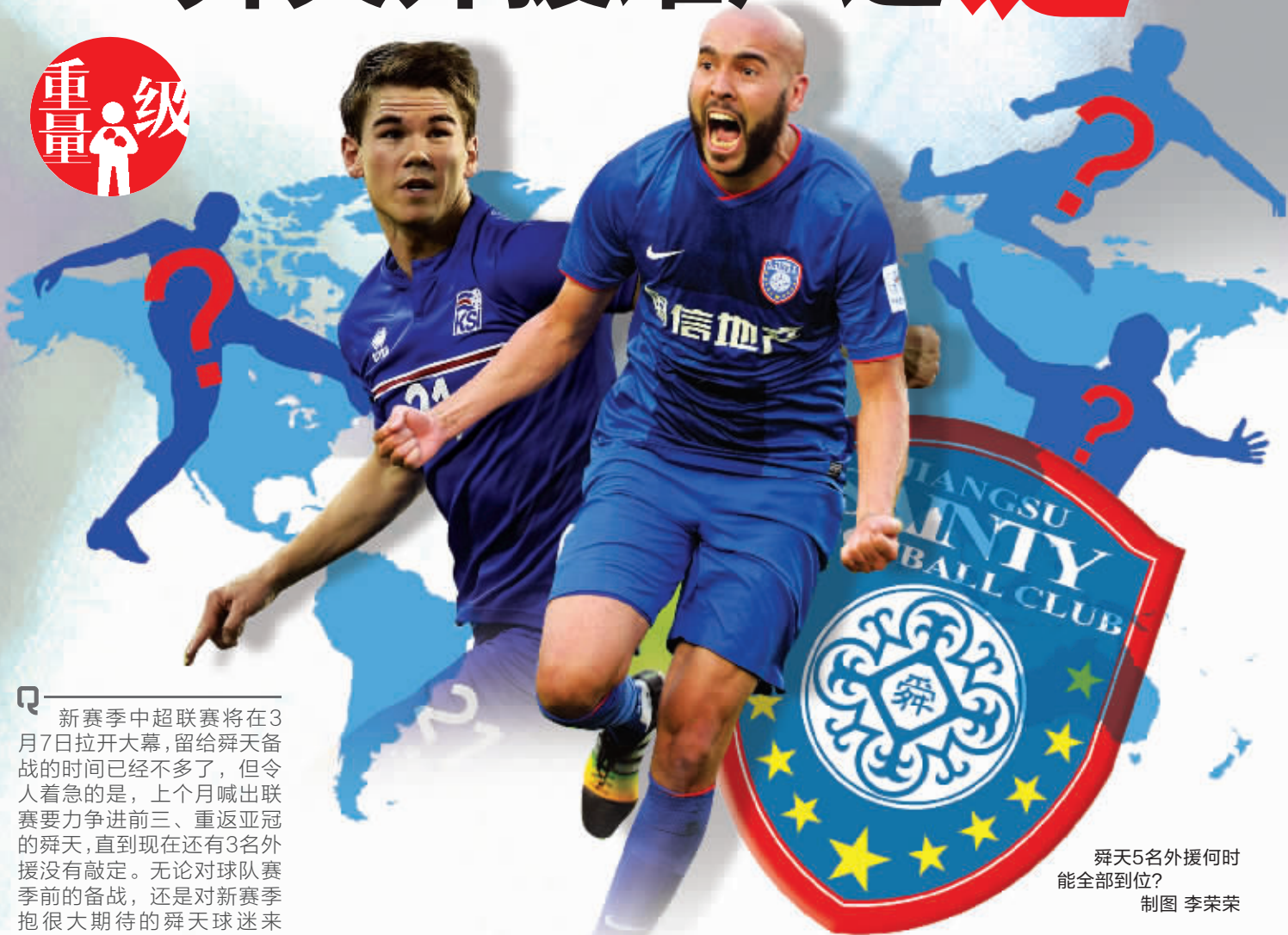
舜天5名外援何时能全部到位? 制图 李荣荣

新赛季中超联赛将在3月7日拉开大幕,留给舜天备战的时间已经不多了,但令人着急的是,上个月喊出联赛要力争进前三、重返亚冠的舜天,直到现在还有3名外援没有敲定。无论对球队赛季前的备战,还是对新赛季抱很大期待的舜天球迷来说,这都是一个不好的消息。