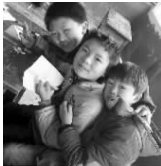
孩子们盼望爸妈回家过年