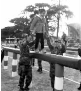
军营生活让小学生在收获不小

而接下来过400米障碍翻越,更让孩子们感叹。需要爬过30厘米长地桩网。翻越2米高墙,过一座独木桥,还要从2米宽的“弹坑”