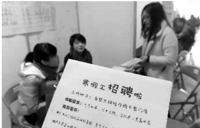
南京一家餐饮企业招大量寒假工