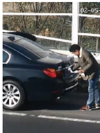
司机撕下遮挡号牌的白布被监控拍下

司机顿时哑口无言,随后交警请驾驶员出示驾驶证,该驾驶员支支吾吾说未带驾驶证。后经网上比对发现该驾驶员驾驶证已于2013年6月18日被注销,高速七大队民警遂将该车暂扣,等待司机将是法律的严惩。