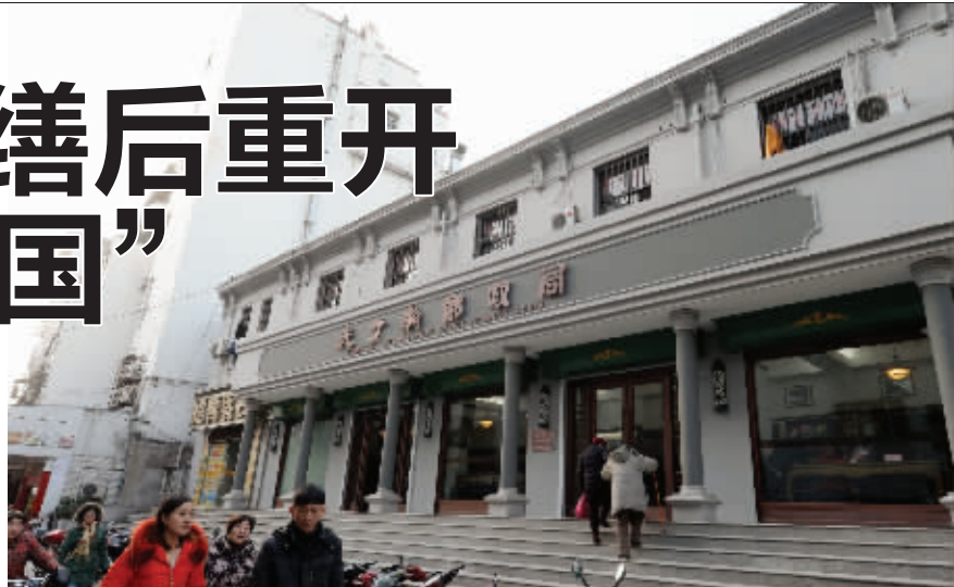
夫子庙邮局现在的门面

很多人对南京建康路的夫子庙邮局印象深刻,二层民国小楼,南北对称。这座早已列入江苏省文保单位的“南京邮政第一局”,近期进行了修缮改造。昨天,现代快报记者探访修缮后试营业的夫子庙邮局。罗马立柱撑起的大门廊、铁质栏杆的古老柜台、怀旧的民国老照片……感觉一秒穿越到了“民国”。