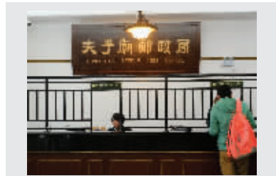
市民在修缮后的邮局办理业务