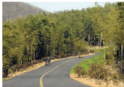
无想山森林公园的竹海大道

无想山位于溧水城南新区,距镇中心4公里,公园总面积为31060亩。公园内有植物557种,野生脊椎动物238种。无想山森林公园东邻东庐山秦淮河源,观音寺,西靠胭脂河天生桥公园,南连傅家边现代农业科技园,北接城区,连接246省道、宁高高速等多条交通要道。南京至溧水的轻轨不久后将通车,终点站为无想山站,市民乘轻轨可直达无想山森林公园。