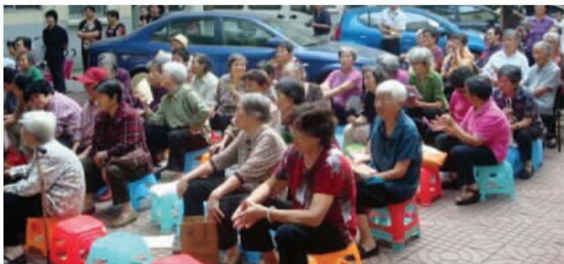
小区的多余地方都被车辆停满,业主搞文体活动也只好在“停车场”内进行

无独有偶,同样在北京东路上有一个名为土壤研究所宿舍的老小区,保安也告诉记者,如果是外来车辆,只要交纳五元钱就可以进小区,想停多久都可以,这都是为了方便接送孩子的家长。