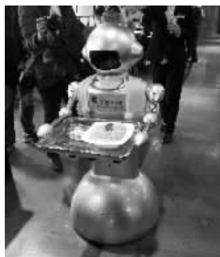
机器人“美羊羊”正在端菜

机器人能帮忙传菜,还会各种礼貌用语——这几天,在镇江的朋友圈里,有一个特殊的“店小二”引发热议。现代快报记者了解到,这个机器人“供职”于东吴路九里街附近的某品牌火锅连锁店,可以沿着设定轨道行走、送菜,它上岗不到一个星期就有了众多粉丝,不少顾客表示,用餐时享受机器人服务,感觉“挺高大上”。