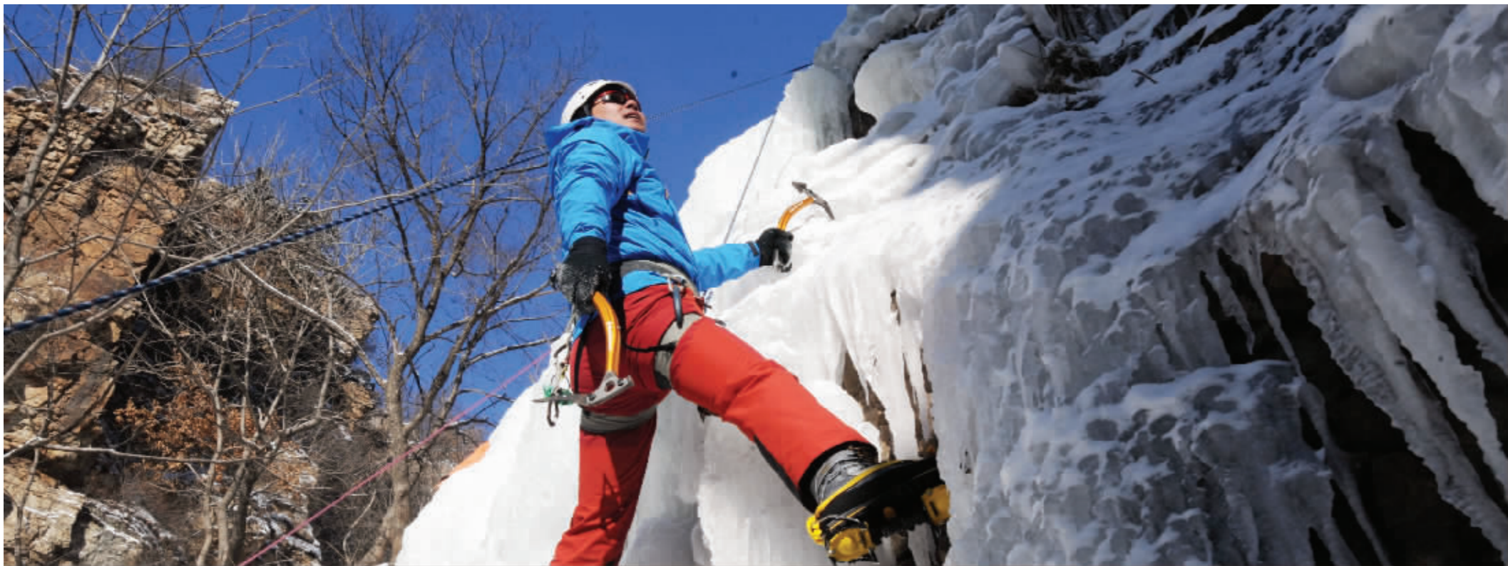
超过40天的寒假,让大学生们有了更多的选择,无论是充电、宅、旅行,都不失为很好的“寒假作业”