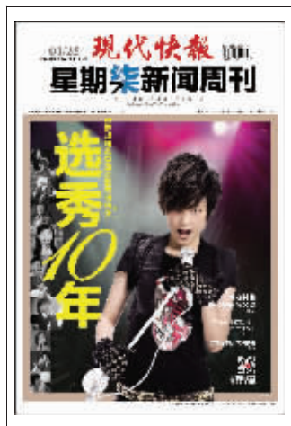
(上星期新闻周刊封面)