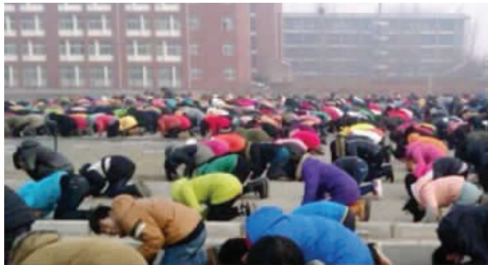
学生集体参加跪拜仪式

1月30日晚,该校罗校长回应记者称,学生跪拜孔子确有其事,但“他们对祖宗圣贤的崇敬是油然而生的”,学校并未强制要求学生下跪。