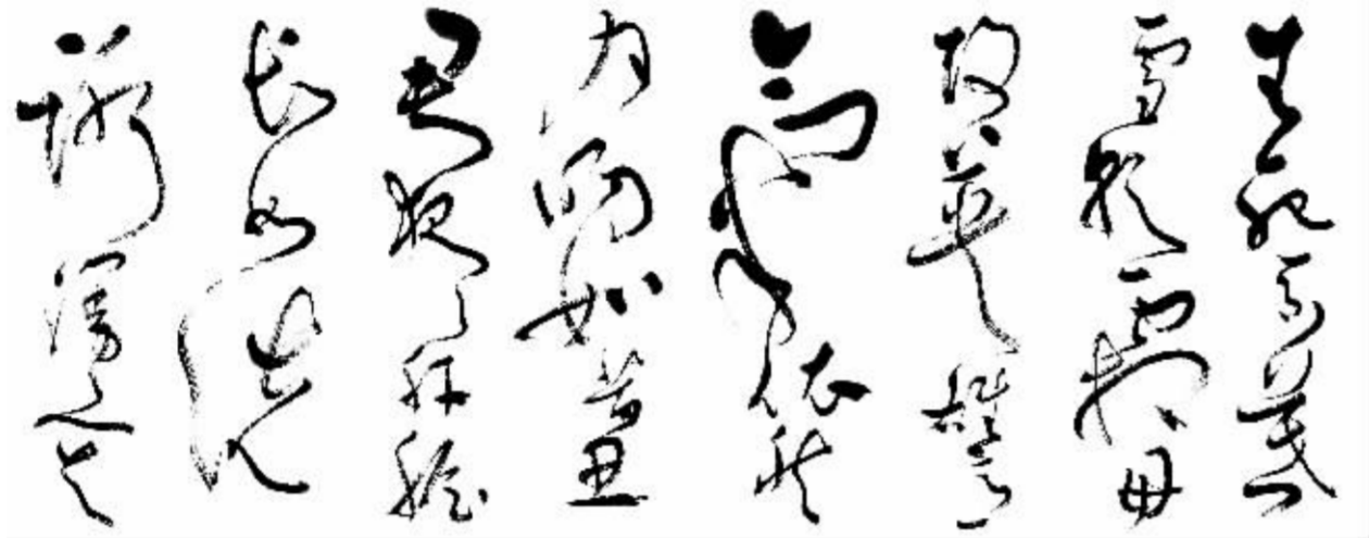
大草《习近平主席词(之二)》

任何艺术家都无权漠视祖先留下的中华文化,都应懂得只有赢得今天的文化创造才能对得起这个时代。习近平总书记在文艺座谈会上的讲话是今天文艺创作方向的导航仪。它解决了面对市场经济大潮的冲击,文艺工作者该怎么办,社会主义核心价值观念是文艺工作者的行为导向。艺术家不能放弃对国家天下、民族命运的责任,他的作品呼应着人民的忧乐,民族精神的凝聚,催化人们向往奋进的良知与情感。“作品是作家、艺术家的立身之本。”一个艺术家,只有做到一是以人民为中心进行创作,二是创作出时代经典的艺术精品,真心实意地做到对时代的感恩,对生活的感悟,对民生的感知,坚守纯净,耐得寂寞,守护文化灵魂,回归艺术心灵,才能真正出精品力作,才能做到胸有大志,腹有诗书,肩有担当,术有专攻。