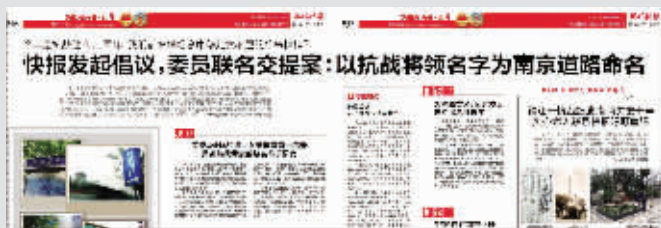
现代快报昨天关于“抗战路名”的报道