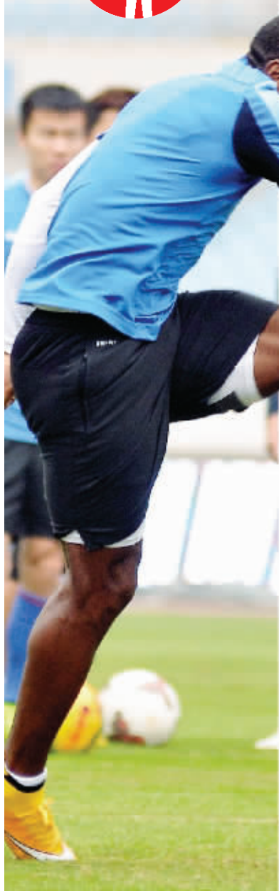
托洛扎上赛季的表现让球迷大失所望