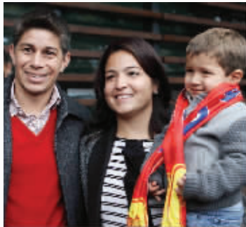
昨天,孔卡抵达上海,这位前恒大外援重返中超引起轰动。新赛季,引进强力外援的上港完全有能力和恒大一较高下。

事实上,和有的俱乐部相比,舜天的引援准备期太短。没有球探,再加上赛季结束后才开始工作,舜天只有仓促地去挑选外援,有时遇到问题,引援工作只有重头再来,比如本来即将加盟的荷兰攻击手德莱乌,如今因为双方俱乐部就转会费付款方式上存在不同意见,而存在交易夭折的局面。