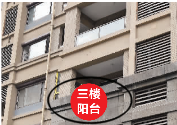
三楼阳台的护栏明显高出许多