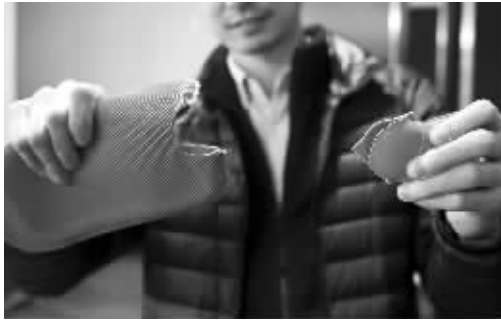
不合格热水袋产品一拉就断掉了