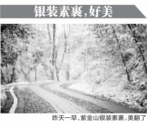
昨天一早,紫金山银装素裹,美翻了