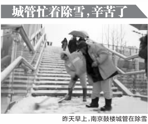
昨天早上,南京鼓楼城管在除雪