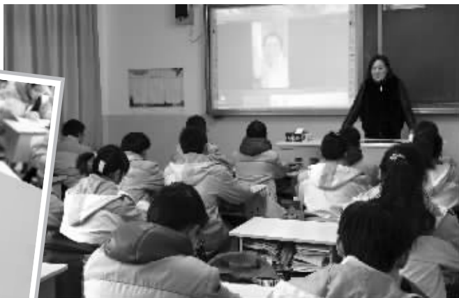
患癌女教师录的视频与学生们“见面”

“本以为我9月份就能回去上课,但是拖了这么久,到现在也没有好……”当戴着口罩的老师出现在屏幕上时,班上的学生纷纷落泪。