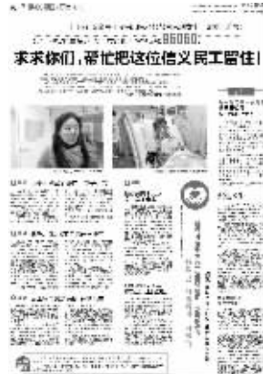
昨天现代快报的相关报道