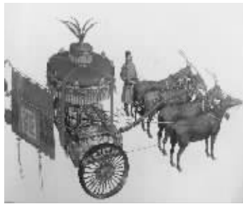
唐代皇家御用“公车”

曾国藩在道光年间连年被提拔,在升为正三品后,按规定轿子应由蓝色换为绿色,护轿人也要增加。但为人谨慎的曾国藩,在升为三品官后,没有增加护轿人,也没有把蓝轿换成绿轿。不久后,曾国藩又升为二品,按官制,他的四抬大轿应该换成八抬大轿,但曾国藩还是没有增加抬轿人。曾国藩在任上的功绩人所共睹,但他也因蓝呢轿而遭到别人的恶意攻击和嘲笑。不管怎么说,曾国藩的做法确实给当时的官场某种警示,当时京城三品以上大员出行,有意无意都要向护轿的官员交代一句:“长点眼睛,内閣学士曾大人坐的可是蓝呢轿!”