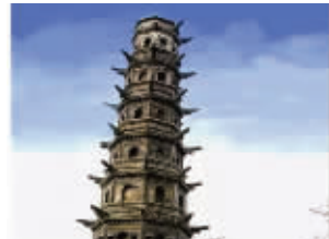
南京方山定林寺塔

快报讯(记者 王颖菲)从弘阳广场到伦敦,摩天轮同样梦幻;从意大利到方山,斜塔同样神奇;从曼哈顿到新街口,夜景同样璀璨……这两天,组照“南京与世界的10个撞脸”,在微博,特别是在南京网友中热传。众人热评,“很美,很自豪!”