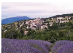
普罗旺斯薰衣草小镇