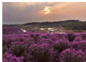
南京江宁谷里薰衣草庄园