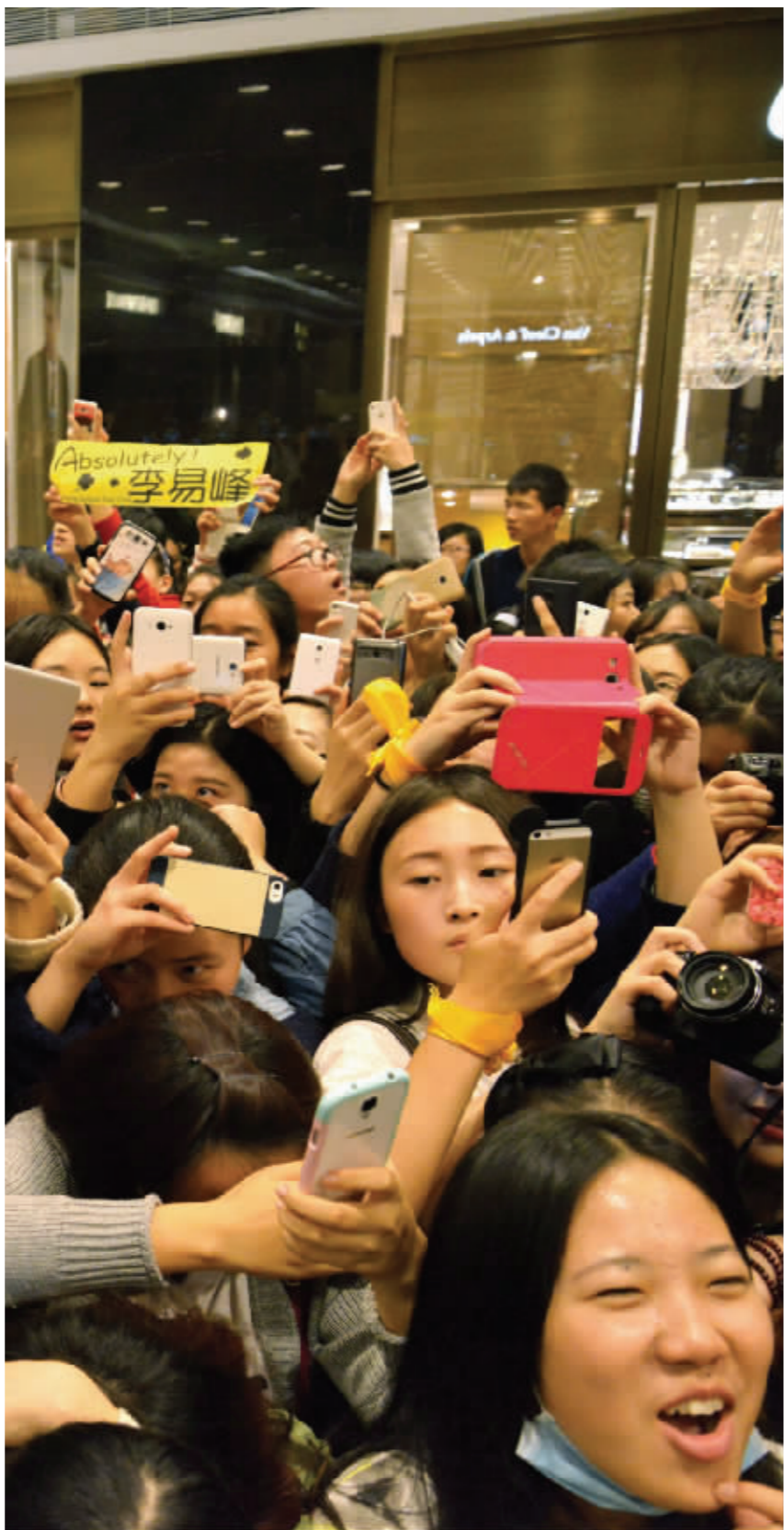
秀场内外粉丝汹涌