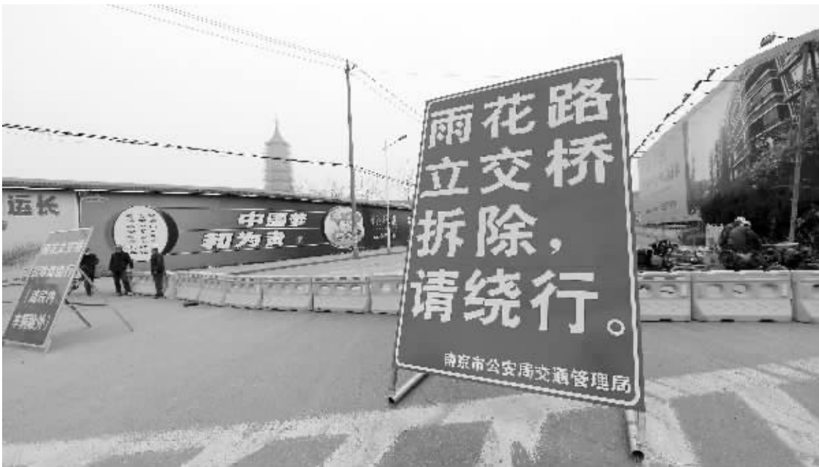
昨天,位于南京中华门外的雨花路立交桥北段封闭拆除,交管部门设置了绕行指示牌