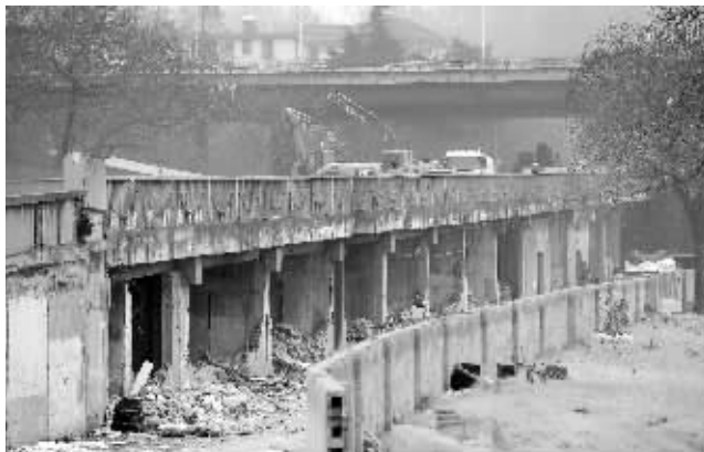
雨花路立交桥北段开始拆除

另外,12条线路调整后,大部分线路里程拉长,不仅如此,部分线路调整后面临其他一些交通节点影响,比如26路、305路、33路调整后,都经过了原本已经有较大通行压力的武定门,加上调整之初公交线路运行需要适应期,因此会出现间隔大运营时间长的现象,该负责人建议市民,要充分考虑到这个情况,出行要留出足够时间。