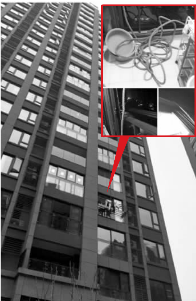
5楼外的绳子和晾衣架很突兀(小图为物业留下的绳子)