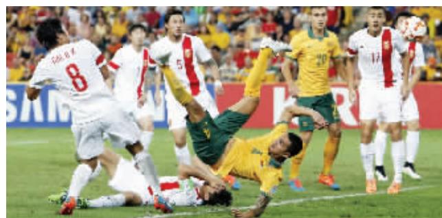
卡希尔在郑智倒地的情况下倒钩得手

国足第一个丢球, 卡希尔在郑智受伤倒地的情况下仍倒钩射门得手, 这个进球在赛后引起争议。王大雷认为主裁判该吹停比赛。