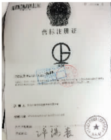
巨星股份提供的GBF的资质证明