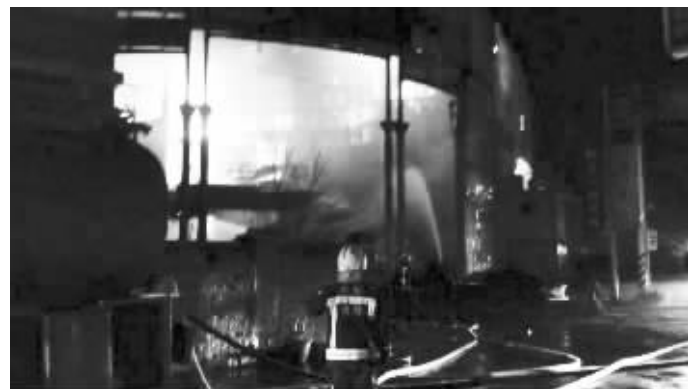
1月20日，消防人员在桃园市新屋区火灾现场扑救

台湾桃园市新屋区一家保龄球馆20日凌晨发生火灾，该市消防局派遣员警赶往现场灭火，6名消防员在火场爆燃中不幸殉职。