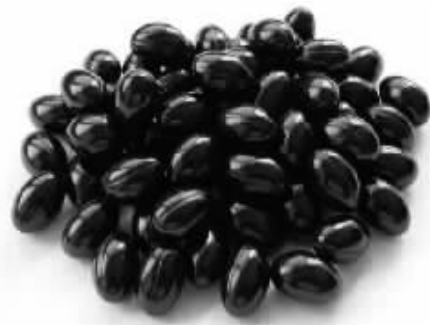
据悉,康富丽蜂胶已被国家相关部门授予蓝帽标志。

据全国多家大型三甲医院临床报告显示,康富丽蜂胶对糖尿病、高血压、高血脂有良效,特别针对糖尿病总有效率高。