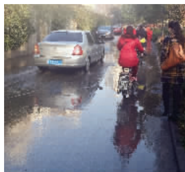
消防栓被撞坏,船板巷淹了