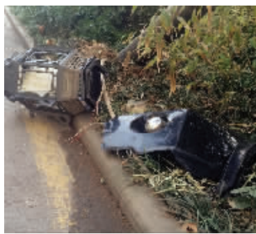
路灯旁残留着奔驰车的部件