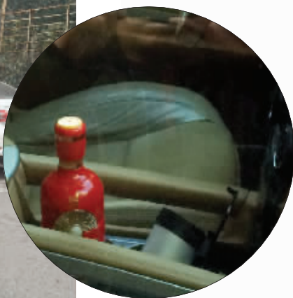
车内还有一个红色的酒瓶