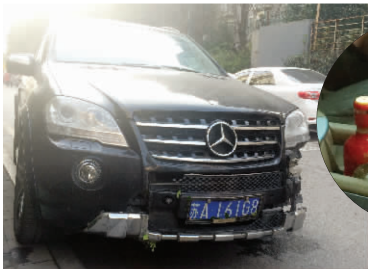
停在路边的奔驰车,左前部受损严重