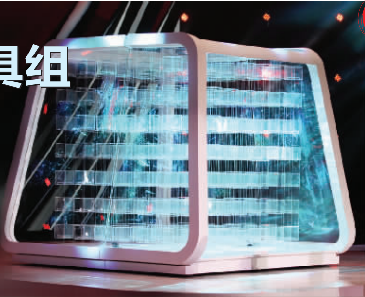
美轮美奂的流体幻立方