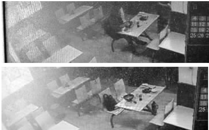
监控画面显示,黄师傅走时忘了拿包