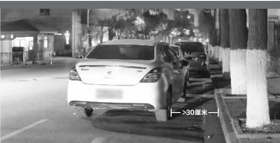
南京虽然对此暂不处罚,但这么停车确实会影响通行